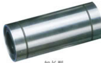
加长型 Long type